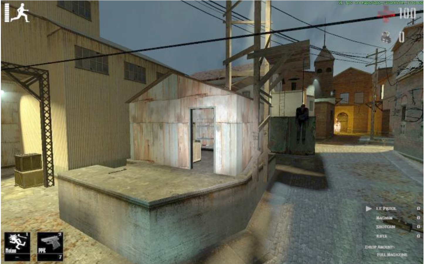
リフト小屋近くの小屋にショットガンと弾薬あり

木の板でふさがれているので破壊し中に入る。その間も後ろからゾンビが来るので壊す人の他に警戒する人も必要、爆発ドラム缶があるのでうまく活用すると吉